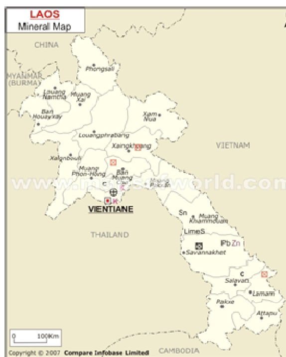
«Pic.2.Laos's mineral recourses»

But our economic interests concern not only ore processing and energy in general. There are some contracts in the sphere of high-technology which were signed in 2010. The most demonstrative example is a deal between Russia's corporation «Vimpelcom» and Laos's company «Millikom Lao». These organizations work with cellular networks. Russian company bought about 78% actions. Thus this deal made to expand the area of cellular network coverage for Russian consumers to all Indochina. It was also beneficial for our economy.